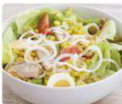
14. ENSALADA MIXTA Mixed salad 6,50€