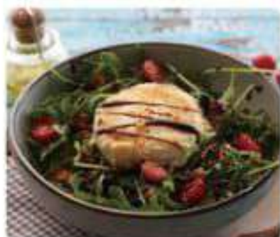
16. ENSALADA QUESO DE CABRA Goat's cheese salad 10,95€