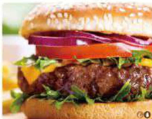
41. HAMBURGUESA DE TERNERA 250GR ESPECIAL (lechuga, tomate, cebolla, queso, bacon y patatas)

Hamburger beef 250gr regular (lettuce, tomato, onion and potatoes) 6,00€