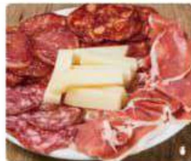
12. SURTIDO IBERICOS Iberian assortment 19,95€