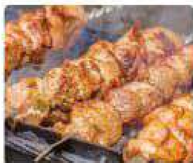
38. PINCHOS MORUNOS Moorish skewers 6,95€