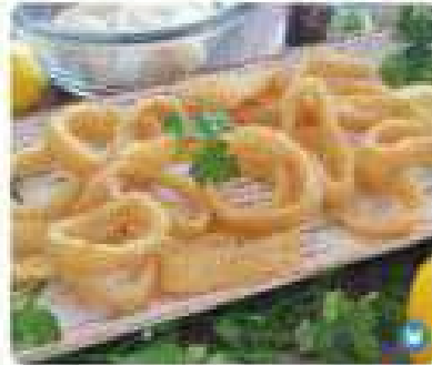
20. CALAMARES A LA ANDALUZA Squids at "Andaluza" style 9,95€