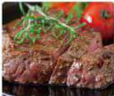
31. SOLOMILLO DE TERNERA Beef tenderloin 19,95€