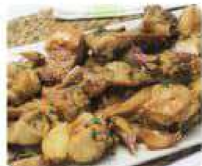
36. CONEJO AL AJILLO Rabbit with garlic 10,95€