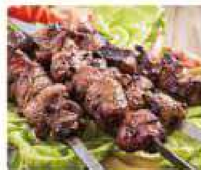
39. PINCHOS DE CORDERO Lamb skewers 10,95€