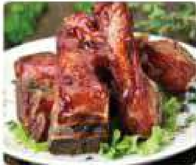
28. COSTILLA BARBACOA BBQ ribs 9,50€