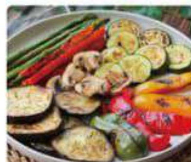
18. PARRILLADA DE VERDURAS A LA PLANCHA Grilled vegetable grill 10,95€