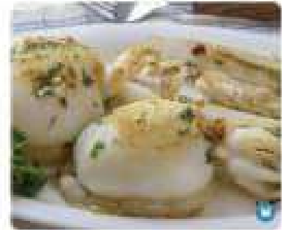
21. SEPIA A LA PLANCHA Grilled cuttlefish 13,95€