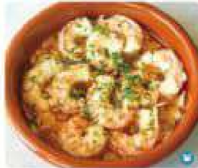
23. GAMBAS AL AJILLO Shrimp Scampi 10,95€