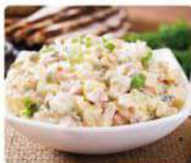
17. ENSALADA RUSA Russian salad 3,95€