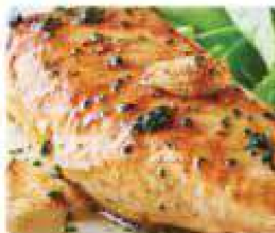
34. PECHUGA DE POLLO Chicken breast 11,95€