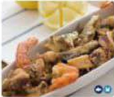
19. FRITURA DE PESCADO Fried fish 19,95€