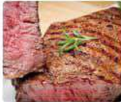
29. ENTRECOT Entrecote 15,95€