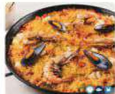
27. FIDEUA (MINI 2 PERS) Fideua (mini 2 people) 9,95€