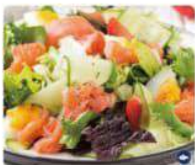
13. ENSALADA SALMÓN AHUMADO Smoked salmon salad 11,95€