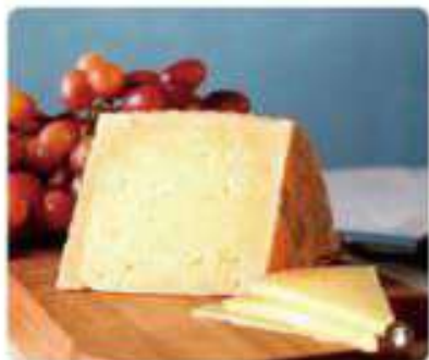
10. QUESO MANCHEGO Manchego cheese 8,95€