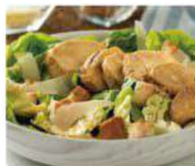
15. ENSALADA CESAR Caesar salad 9,95€