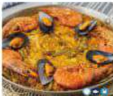
25. PAELLA MIXTA (MINI 2 PERSONAS) Mixed paella (mini 2 people) 10,95€