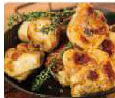
35. POLLO AL AJILLO Garlic chicken 10,95€