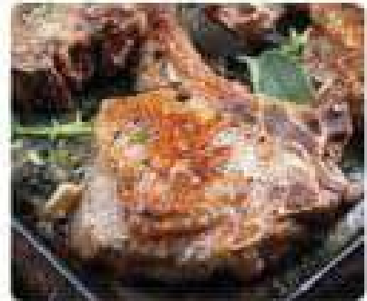
30. CHULETON DE TERNERA Veal steak 19,95€