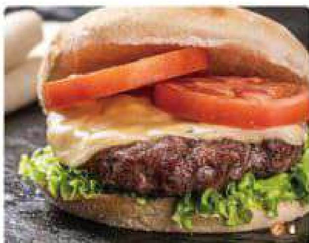
40. HAMBURGUESA DE TERNERA 250GR NORMAL (lechuga, tomate, cebolla y patatas)

Hamburger beef 250gr regular (lettuce, tomato, onion and potatoes) 6,00€