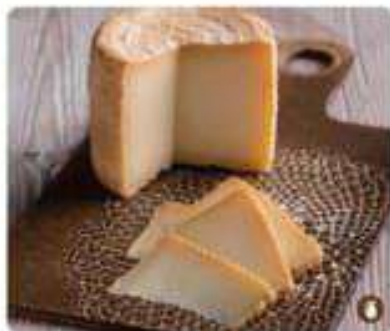
11. QUESO CURADO Cured cheese 15,95€