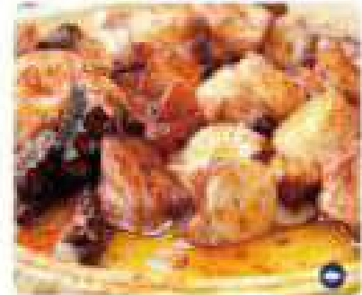
24. PULPO A LA GALLEGA Galician octopus 13,95€