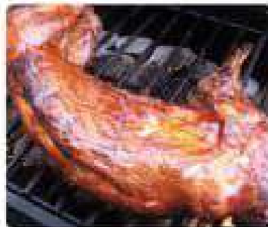
32. CONEJO A LA BRASA Grilled rabbit 10,95€