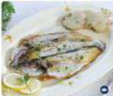
22. LUBINA A LA PLANCHA Grilled sea bass 14,95€