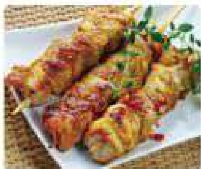
37. PINCHOS DE POLLO Chicken skewers 6,95€