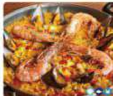
26. PAELLA DE MARISCOS (MINI 2 PERSONAS) Seafood paella (mini 2 people) 10,95€