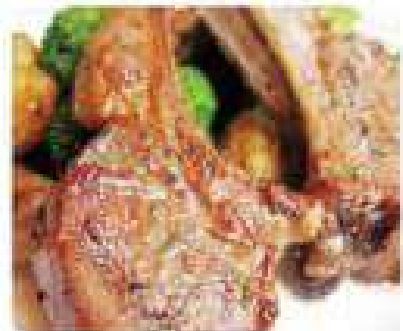
33. CHULETAS DE CORDERO Lamb Chops 15,95€